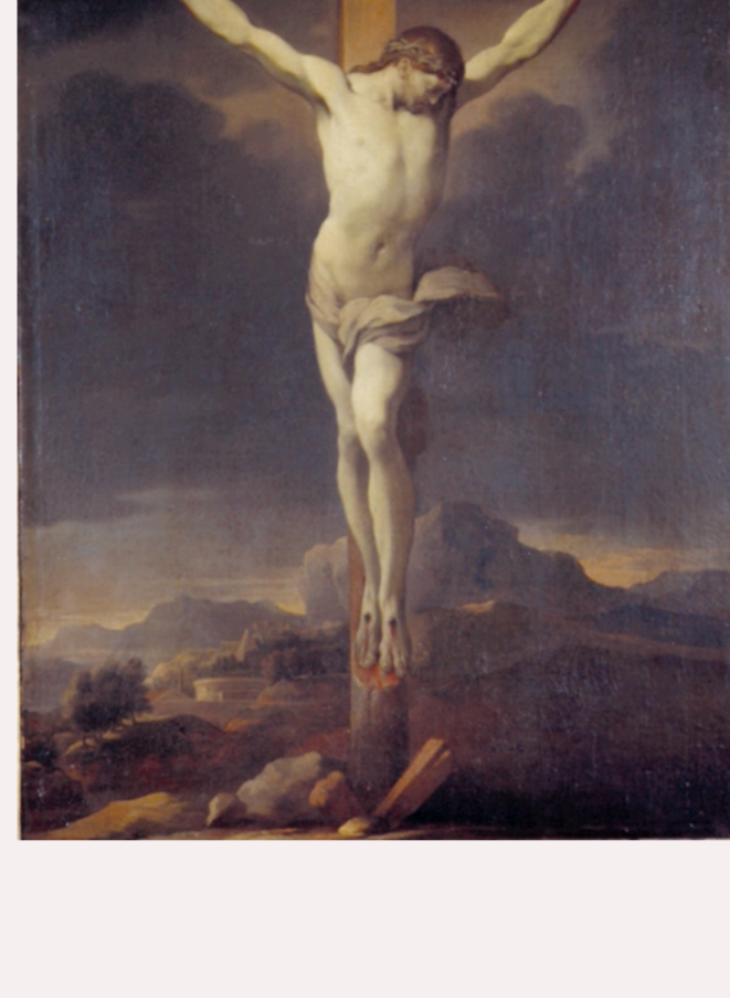
photo : Le Christ en Croix de Lubin Baugin (17ème siècle), conservé dans la sacristie de l'église des Billettes.

Cet office a été accompagné par des extraits de La Passion selon Saint Jean de J-S Bach, à l'orgue et par 4 chanteurs.