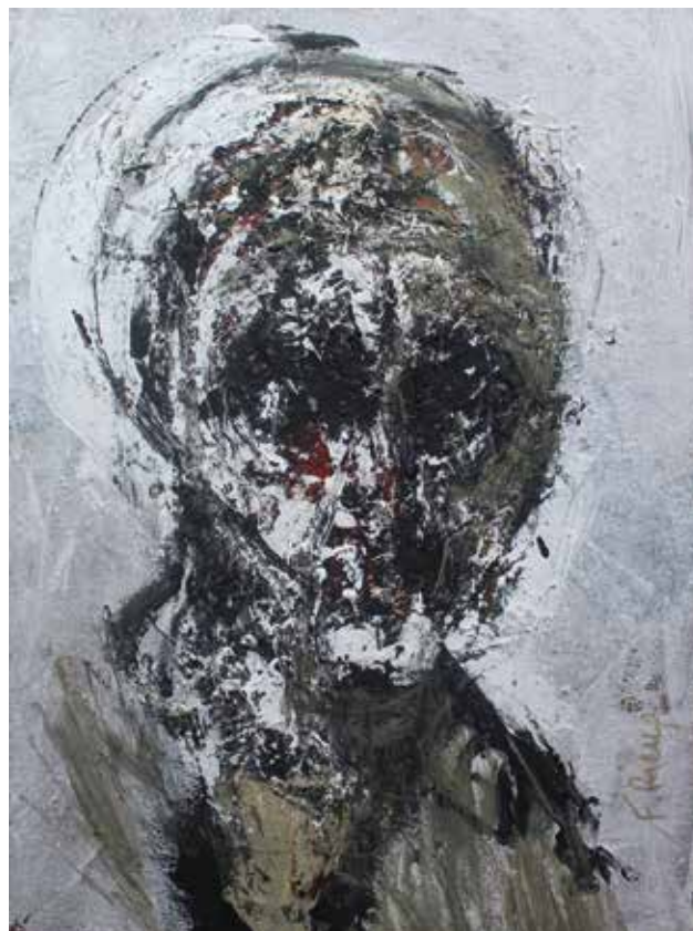
La cévenole, 81 x 60 cm

Marie Durand naquit en 1711 et mourut en 1776 à Pranles, près de Privas (Ardèche) dans une famille aux profondes convictions protestantes. Son frère Pierre, prédicateur clandestin, fut exécuté en 1732. Son père fut arrêté en 1729 et envoyé au bague. Âgée de 19 ans, elle fut à son tour emprisonnée l'année suivante, tout comme son mari. Refusant d'abjurer sa foi, elle resta enfermée dans la Tour de Constance, à Aigues-Mortes, jusqu'en 1768. Son courage, sa ferme conviction et le fait qu'elle fut lettrée lui conférèrent vite un ascendant sur ses compagnes. Elle devint un exemple de la résistance à la discrimination imposée par l'État et la hiérarchie catholique. L'inscription " RESISTER ", gravée sur la margelle du puits de la prison, est attribuée sans vraie certitude à Marie Durand, mais elle symbolise, pour le peuple protestant, la foi et l'exhortation à l'Espérance. Par-delà les aspects religieux de son combat, Marie Durand peut être considérée comme une figure emblématique de résistance pour toutes les femmes, et aussi tous les hommes, qui luttent pour leur liberté de conscience.