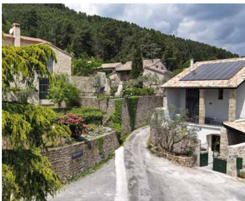
Les résidences du jardin Mercurart